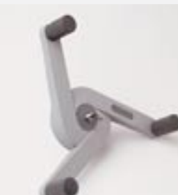
Zentralverschluss im Drehstern für Compactus®

Im Drehstern für jeden Wagen erhältlich. Der Benutzer ist im Gang gesichert, da das Verfahren des Wagens vermieden wird.