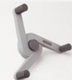
Gangverriegelung für Compactus® und Compactus® Office

Für die Umstellung von offenen Regalen in geschlossene Schränke.