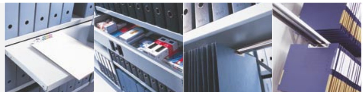
Auszugboden Schublade ZT-Pendelschiene für Hängemappen und CD Elba-Pendelschienen

Zur Schaffung eines hochstehenden Randes an der Vorder- oder Rückseite eines Fachbodens. Zur Schaffung eines hochstehenden Randes zwischen zwei Fachböden. Nur bei Doppelregalen zu benutzen. Verhindert das Herausfallen des Lagergutes. Zur Regalbeschriftung.