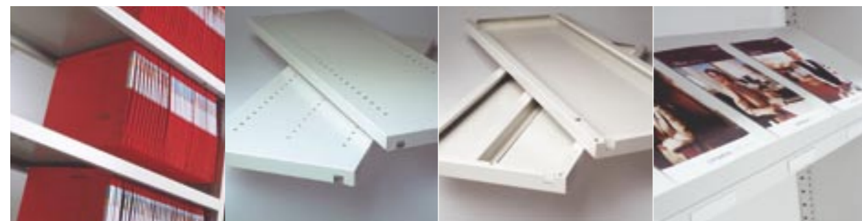
Fachboden Fachboden, 2 oder 3 Lochreihen Verstärkungsrippe Zeitschriftenboden mit magnetischen Etiketten

Zur Aufbewahrung diverser Unterlagen und kleiner Gegenstände. Ein Fachboden mit NT 390 mm eignet sich auch für laterale Hängemappen mit 2-Punkt-Aufhängung. Zur Einrichtung von Facheinteilungen mit Hilfe von Fädelstäben oder Trennplatten aus Stahl. Zur Erhöhung der Belastbarkeit eines Fachbodens. Nur für Fachböden ab NT 350 mm. Zeitschriftenboden für die Präsentation von Dokumenten und magnetische Etiketten zu Befestigen an den Fachböden.