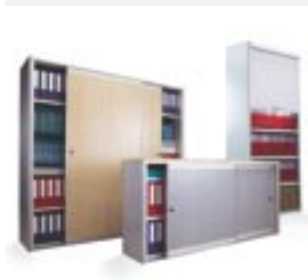
Schiebetüre und Rolltüre

Zum Abstützen einer Bücher-, Ordner- oder Dokumentenreihe. U-förmig für Fachböden mit NT 200, 250 oder 270 mm. W-förmig für Fachböden mit NT 300 bis 450 mm.