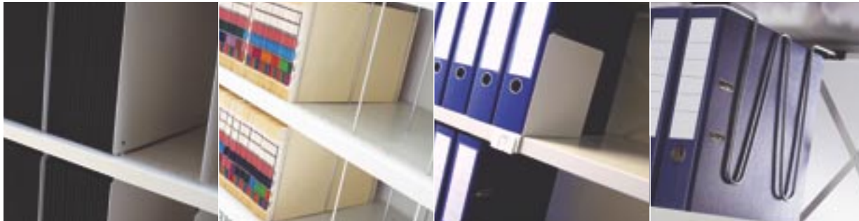
Trennplatte aus Stahl