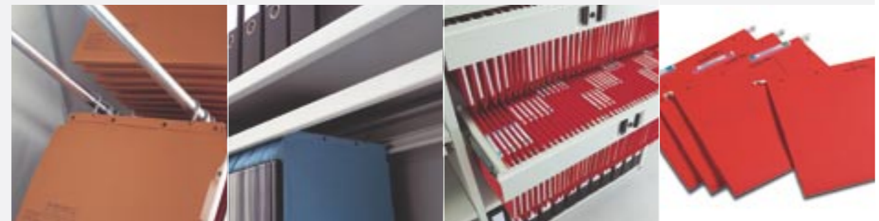
l'Oblique/TUB-Rahmen Lateral Rahmen Hängeauszug Multi-File

Für den Gebrauch als Arbeitsplatte oder zum zeitweiligen Ablegen von Dokumenten oder kleinen Gegenständen. Nur für Regaltiefen mit NT 250 bis 450 mm. Zum Aufbewahren kleinerer Gegenstände. In der Schublade können Facheinteilungen angebracht werden. Nur für Regaltiefen mit NT 300 bis 450 mm. Die Schubladen können mit verschiedenen Verschlussmechanismen ausgestattet werden. Für die Aufbewahrung lateraler Hängemappen vom Typ Zippel oder Jalema. Nur für Regaltiefen mit NT 350, 370, 390, 400 oder 450 mm. Auch für die Aufbewahrung von Jalema CD-Hängemappen. Nur für Regaltiefe NT 200 mm. Für die Aufbewahrung lateraler Hängemappen mit einer 1-Punkt-Aufhängung von Typ Elba, Leitz oder Pendex. Für Regaltiefen mit NT 350, 370, 390, 400 oder 450 mm. NT>450 mm nur auf Anfrage.