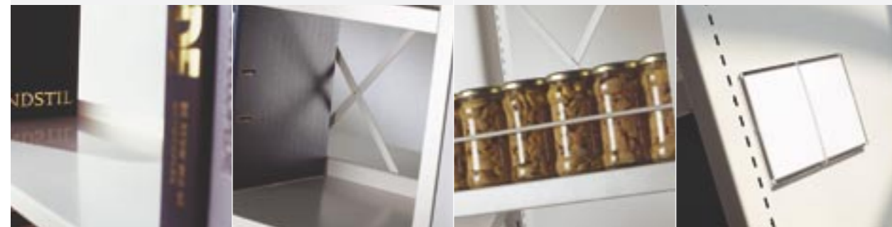
Fachbodenanschlag Mittelanschlag Front stop Etikettenträger

Zur Aufbewahrung diverser Unterlagen und kleiner Gegenstände. Ein Fachboden mit NT 390 mm eignet sich auch für laterale Hängemappen mit 2-Punkt-Aufhängung. Zur Einrichtung von Facheinteilungen mit Hilfe von Fädelstäben oder Trennplatten aus Stahl. Zur Erhöhung der Belastbarkeit eines Fachbodens. Nur für Fachböden ab NT 350 mm. Zeitschriftenboden für die Präsentation von Dokumenten und magnetische Etiketten zu Befestigen an den Fachböden.